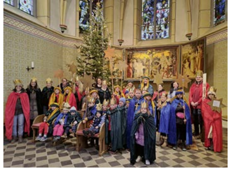
Bundenbach und Rudolfshaus